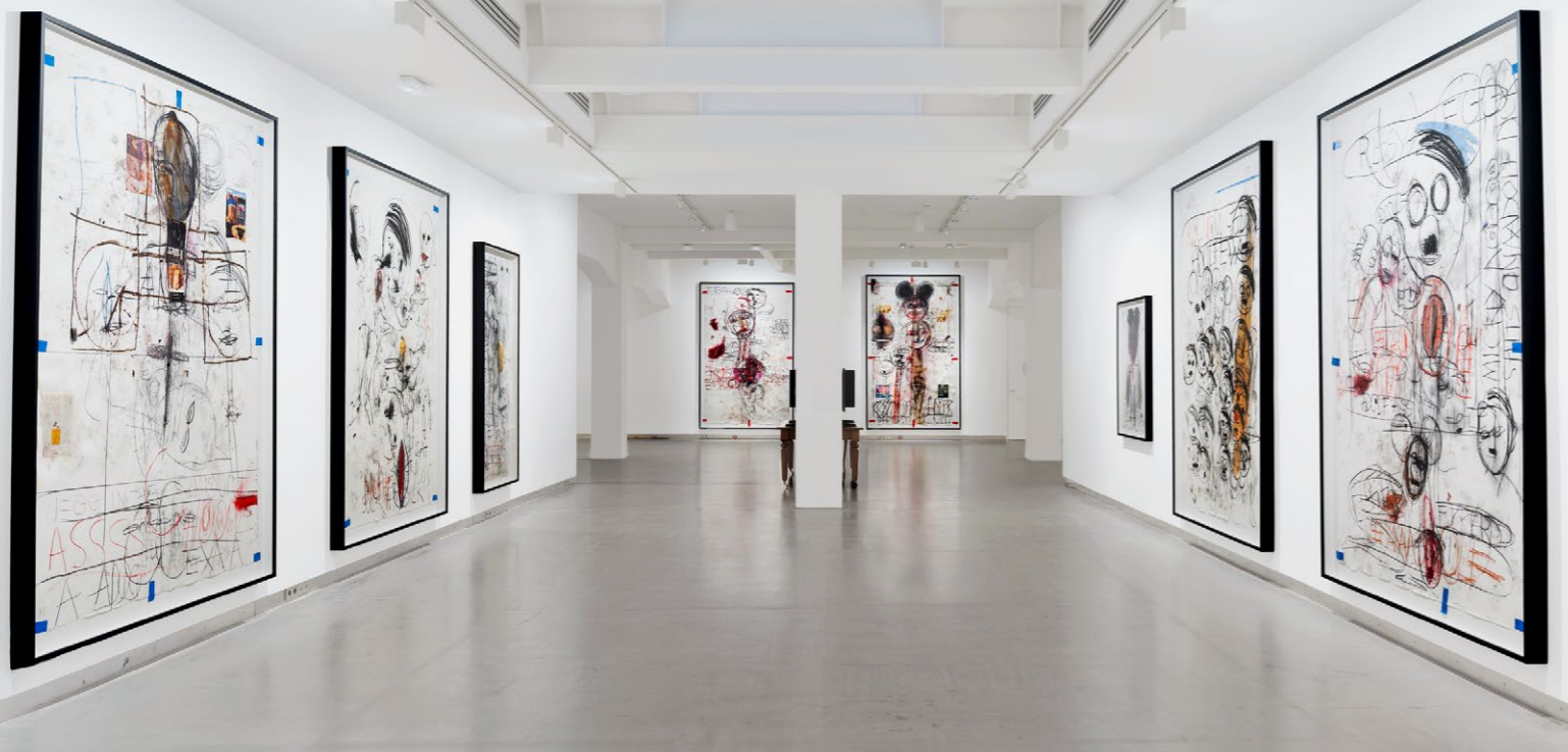
GEGENWARTSKUNST Im Solo CSV, einer ehemalige Druckerei, dreht sich alles um Gegenwartskunst. Bis am 11. Juli sind die grossformatigen Werke von Paul McCarthy zu sehen.

in einem anderen steht ein Esstisch für 120 Gäste. Gleich neben dem Palast wurde im Sommer 2023 mit der Galería de las Colecciones Reales Spaniens bedeutendstes Museumsprojekt seit Jahrzehnten eröffnet. Die von spanischen Königen über ein halbes Jahrtausend zusammengetragene Sammlung residiert hinter einer grau-weissen, 145 Meter langen Granitfassade und lockt mit noch nie gesehenen Kunstwerken von Velázquez oder Caravaggio und einer Terrasse mit Aussicht.