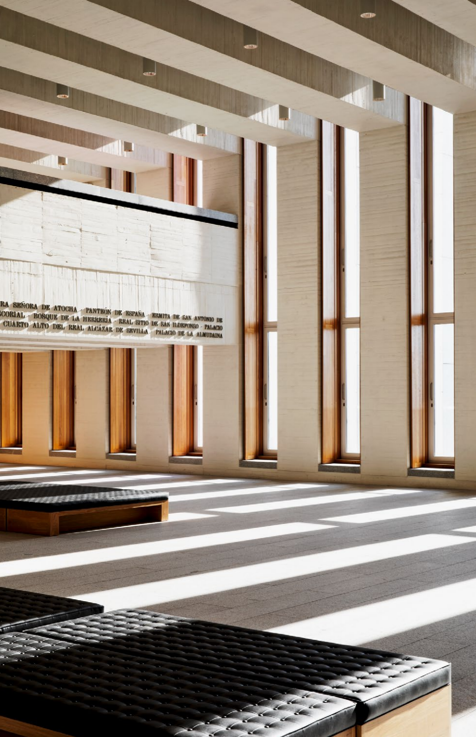
KUNST In der Galeria de las Colecciones Reales wird Geschmack, Ästhetik und die ehemalige Macht der spanischen Krone – von den Habsburgern bis zu den Bourbonen – inszeniert.

versperren. Das schicke Café ist das Stammlokal der Fashionistas und ein hervorragender Ort, um die modebewussten Stadtbewohner zu beobachten.