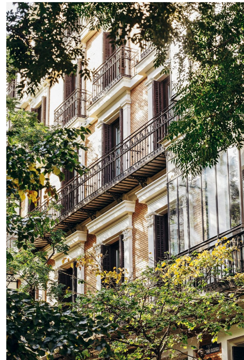
MIT PATINA Hinter den Fassaden mit Alte-Welt-Charme residieren immer mehr Expats, die dem Madrider Flair verfallen sind.

Als Topadresse für High-End-Mode gilt der Stadtteil Salamanca. An der Calle de Serano steht der dreistöckige Lifestyle-Store des spanischen Luxusbrands Loewe, der ein denkmalgeschütztes Gebäude aus dem 19. Jahrhundert bespielt. In Rufweite sind fast alle bekannten Namen der spanischen Modewelt zu finden, von Balenciaga und Manolo Blahnik über Adolfo Domínguez und Roberto Verino bis zu Pedro del Hierro und Javier Simorra. Ihre Logos prangen auf grossen Einkaufstaschen, die an sonnigen Tagen die Durchgänge zwischen den Terrassentischen des «Cappuccino Madrid»